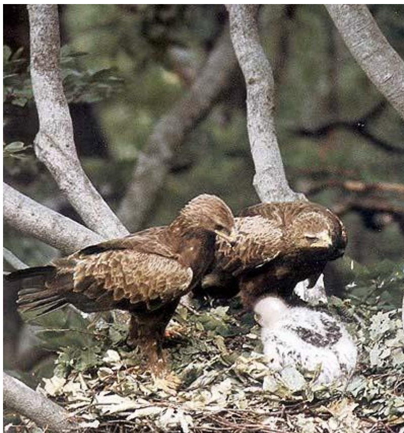
Малки кресливи орли (Aquila pomarina) в гнездо с малко.

На територията на ТП „ДГС Върбица“ е регистриран през гнездовия период в следните отдели: 124