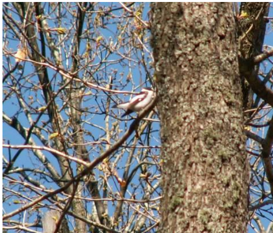
Полубеловрата мухоловка

Установен в следните отдели и подотдели: 5к,5и, 6о, 6м, 7е, 7ж, 7з, 9м, 9л, 9р, 21, 22, 23и, 23з, 30, 39, 51, 65,66, 71р,72д,72з, ,75,78,188,191,197,199,200,201,203.