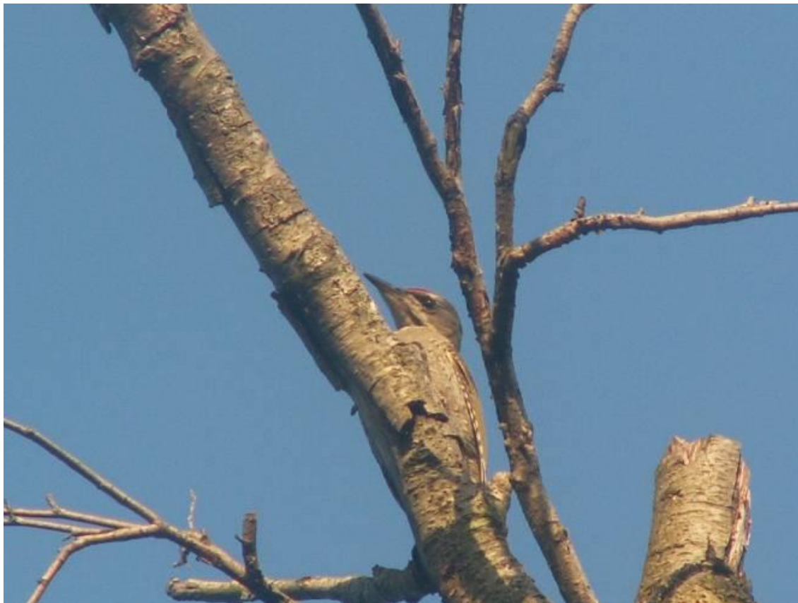
Сив кълвач ( Picus canus )